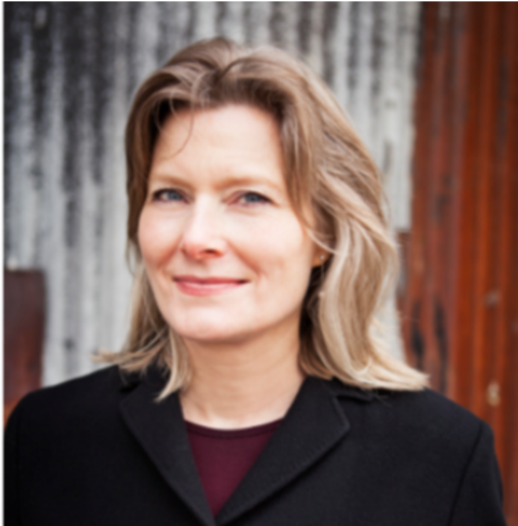
Jennifer Egan, présidente, PEN Amérique