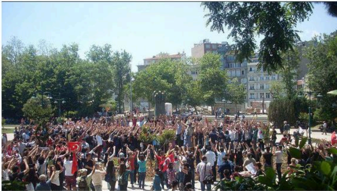
Protests at Gezi Park on 3rd June 2013.

https://penquebec.org/2020/02/17/pen-soutient-yvan-godbout/