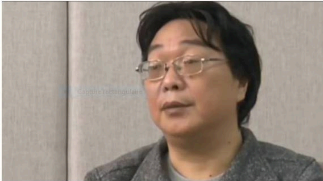
Publisher and PEN member Gui Minhai