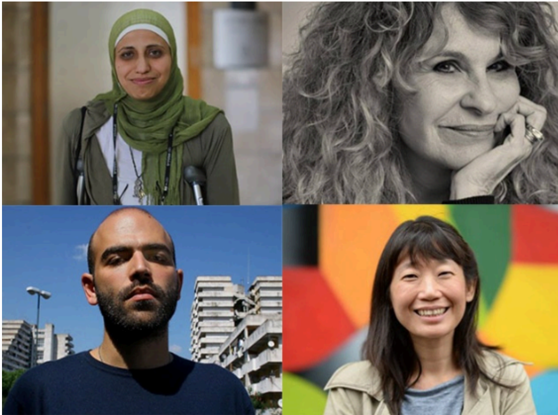
Clockwise from top left: Daren Tatour, Gioconda Belli, Madeleine Thien, Roberto Saviano