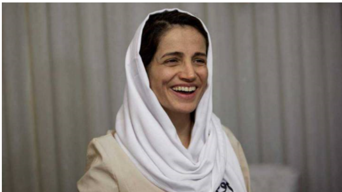
Nasrin Sotoudeh.

Au total, 431 prisonniers ont été graciés ou ont vu leurs peines commuées le 16 mars 2019, blogueurs et journalistes compris. La communauté PEN a milité activement pour la libération de Rashad Ramazanov, plus récemment pendant sa grève de la faim; entre autres interventions, elle a adressé des appels aux autorités azerbaïdjanaises, rassemblant des messages de soutien et sensibilisant le public à sa situation.