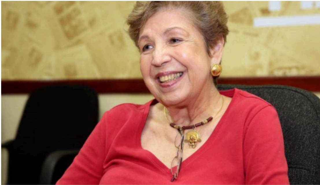
Novelist, journalist and dedicated PEN member Gloria Guardia de Alfaro (1940–2019)