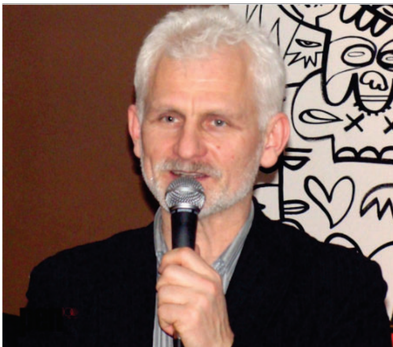
Alès Bialiatski