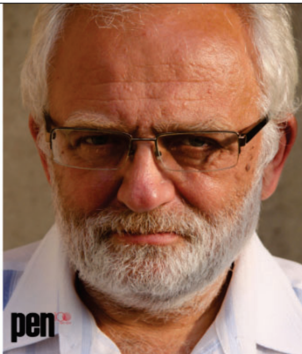
Ouladzimir Mackievič (CC Wiki Commons)