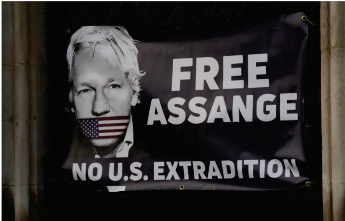
Une bannière montrant le visage de Julian Assange a été prise en photo en décembre 2021.