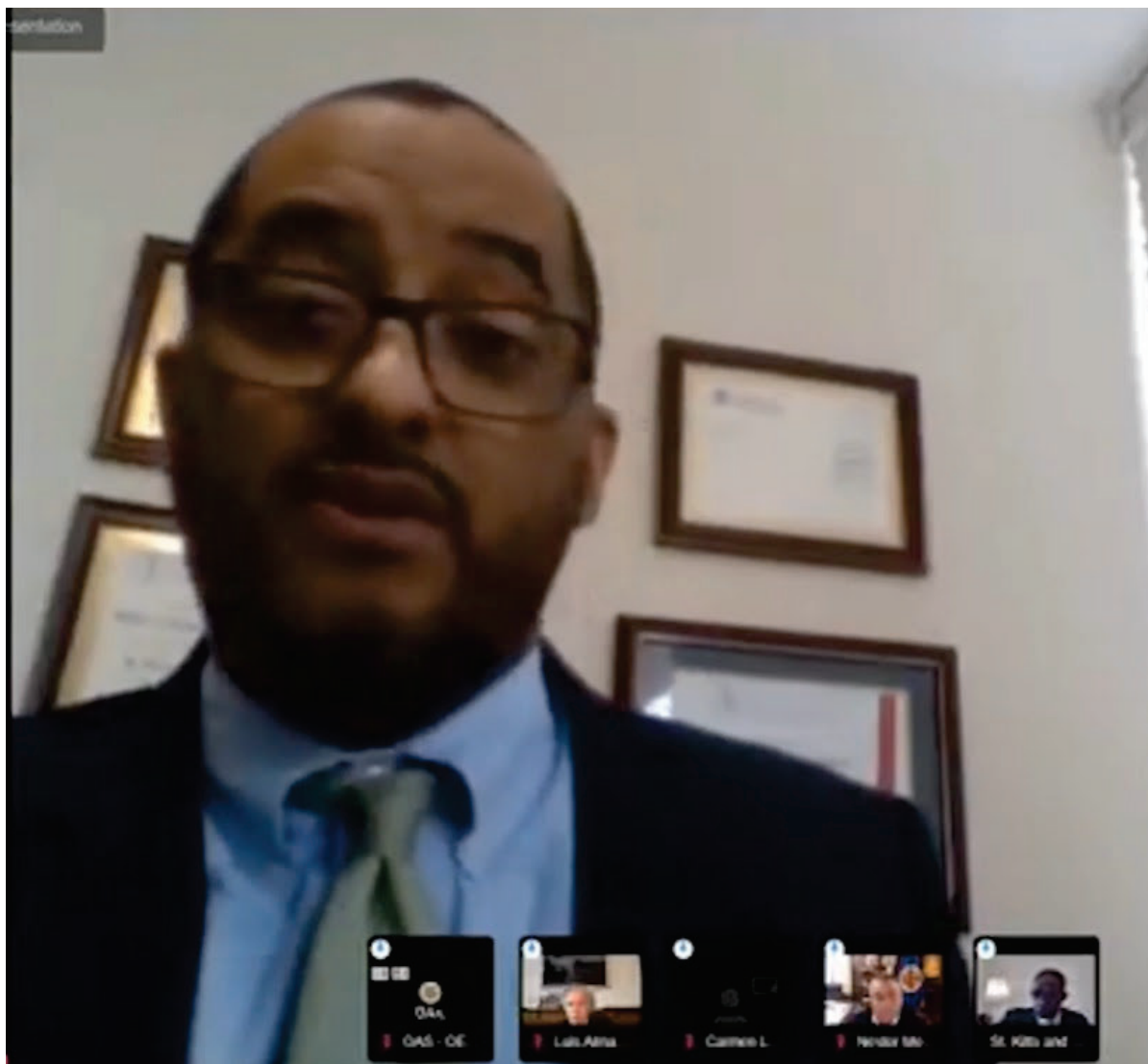
Photo : Dans un discours inattendu, l'ambassadeur du Nicaragua auprès de l'Organisation des États américains, Arturo McFields, a dénoncé le mercredi 23 mars 2022 son propre gouvernement qu'il a qualifié de « dictature ».