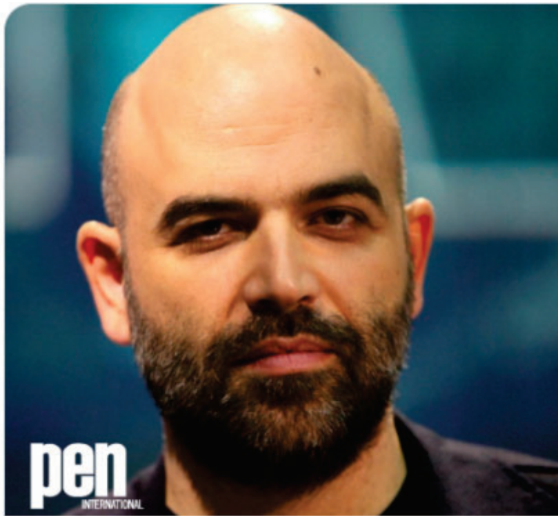
Photo : Roberto Saviano risque jusqu'à trois ans de prison s'il est reconnu coupable.