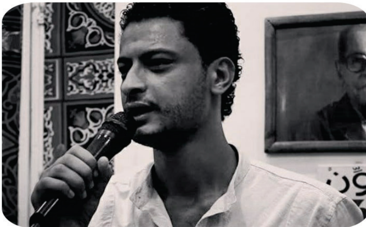
Galal El-Behaïry, photo credit: private collection

Les journalistes, arrêtés par la police trois jours auparavant, travaillaient avec l'évêque catholique Rolando Álvarez, responsable de la gestion du diocèse de Matagalpa. Le prélat a été arrêté le 19 août et inculpé officiellement le 13 décembre devant les tribunaux pour « conspiration » et « propagation de fausses nouvelles ».