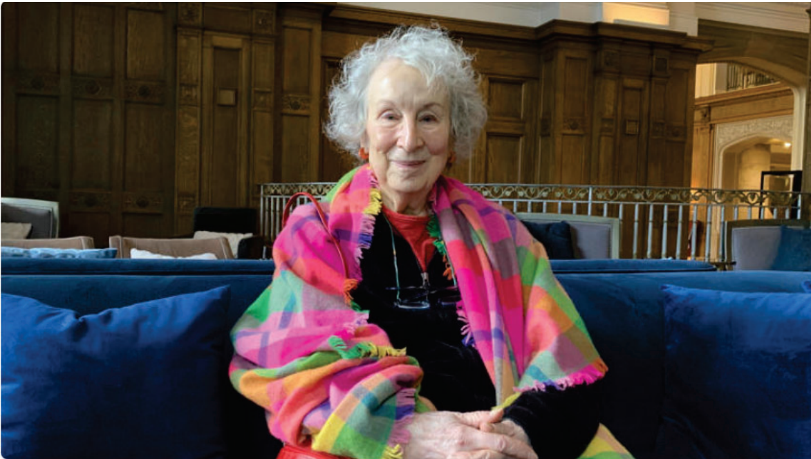
└ Margaret Atwood