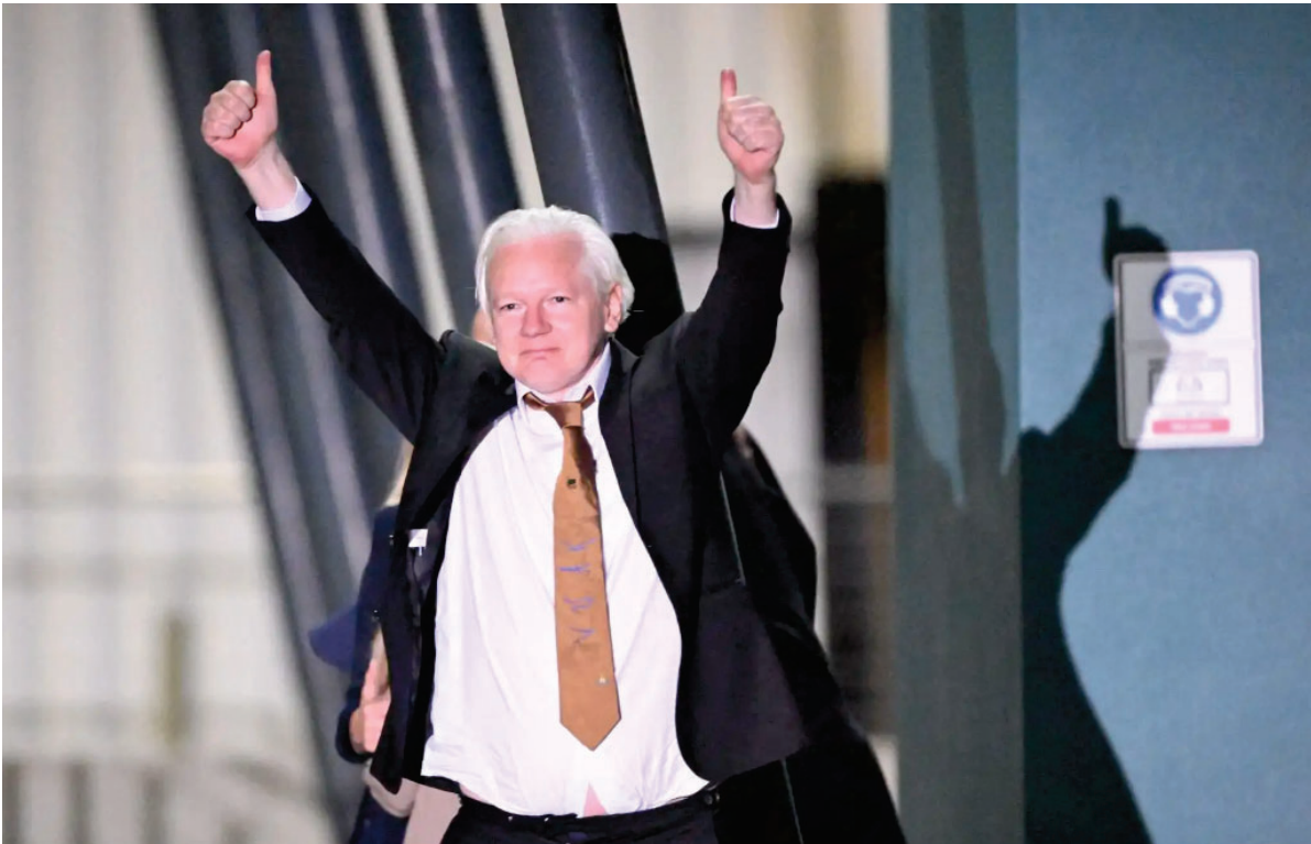
Julian Assange a célébré sa libération dès au'il est descendu de son avion à Canberra.